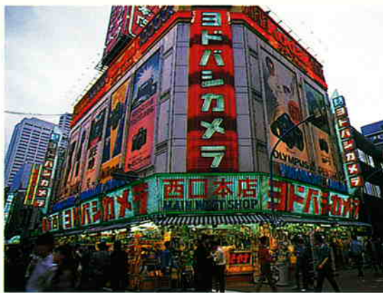
BMW är det största importmärket på den japanska bilmärknaden.

Alla delar som kan återvinnas demonteras, sorteras och skickas till specialister för att bli nya råvaror.