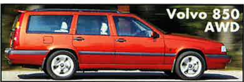
Volvo 850 AWD