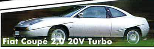
Fiat Coupé 2,0 20V Turbo