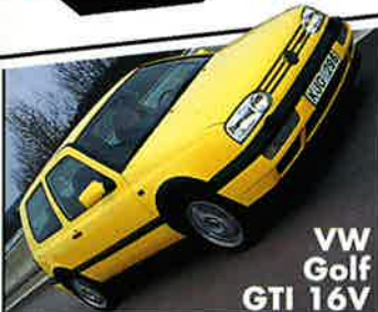
VW Golf GTI 16V