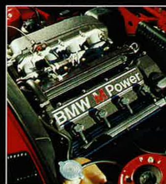
MUSKLER. Första versionen av M3-motorn gav 195 hk med katalysator. Magnus har en bit över 200 hk tack vare chipstrimning och annan luftfilterbox.

Alla som haft förmånen att ratta nya M3:an förstår hans entusiasm. Maken till bil är svår att hitta. Snäll