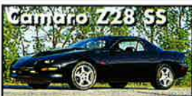
Camaro Z28 SS