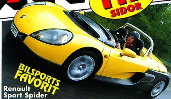
BILSPORTS FAVORIT Renault Sport Spider