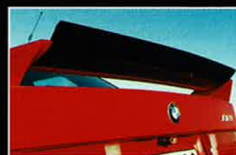
STÄLLBAR. I Sport Evolution-kitet ingår bland annat justerbar bakvinge. Både fräckt och funktionellt. Genom att ändra vingens vinkel påverkas bakvagnens "downforce".